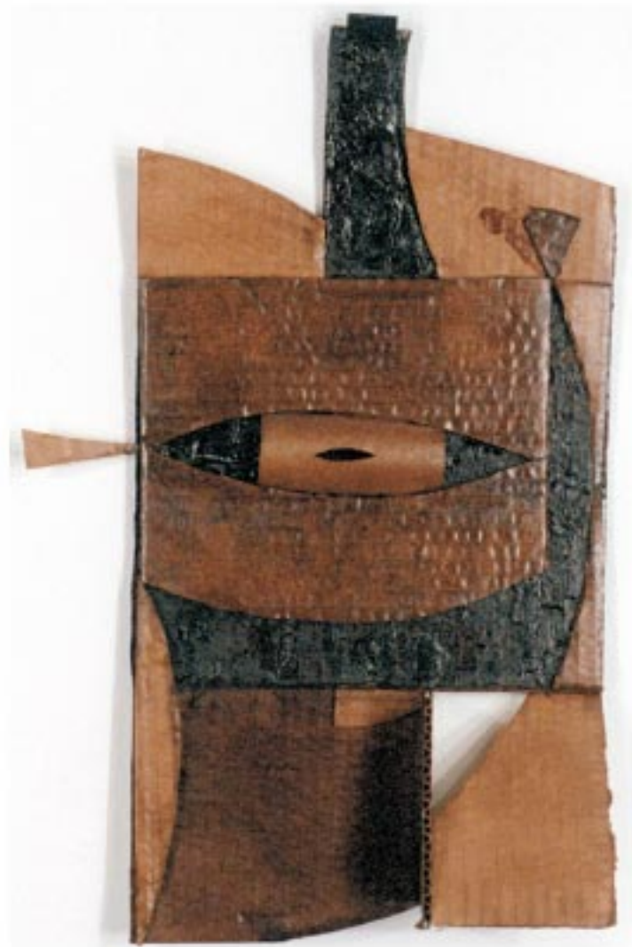
Tabla de pescado

Cartón corrugado, betún de judea. 35x130x50 Año 1999